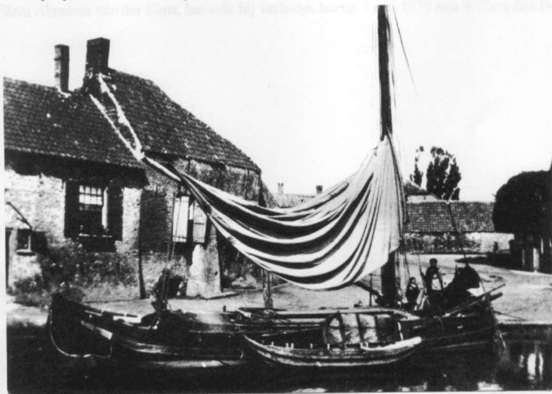
Haven van Poortugaal met op de achtergrond de schipperswoning.