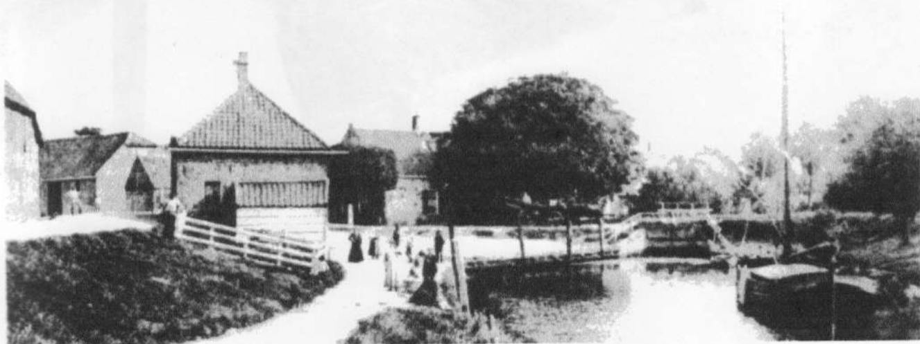
Haven met Kade, Poortugaal