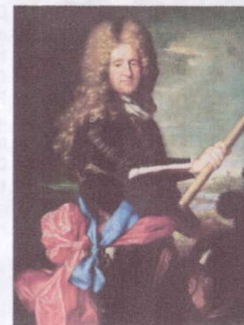
Hans Willem Bentinck

Door aankoop van Rhoon werd Bentinck toegelaten tot de Staten van Holland, want: wie Rhoon bezat, had macht!