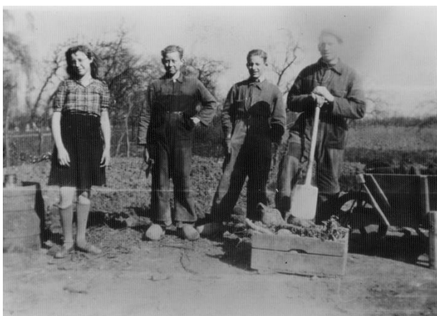
Eigen fabricage van bietenstroop in 1944.

Wat we hier merkten was dat alle bezettingstroepen naar Frankrijk vertrokken om de geallieerden te bevechten. Het barakkenkamp bij het kasteel in Rhoon werd afgebroken.