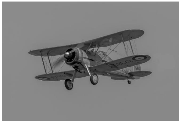
Een Engelse tweedekker.