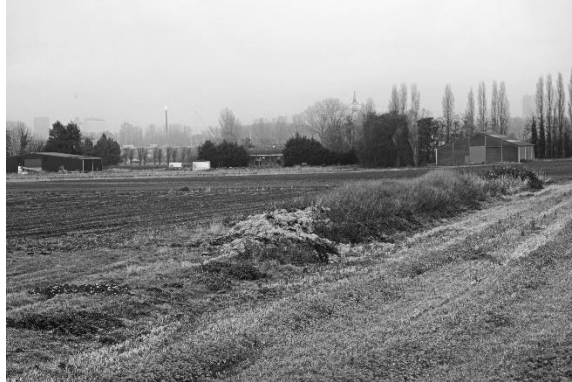
Antitankgracht aan de Essendijk (ter hoogte van nr. 34) anno 2019.

tegen een losgeraakte elektrische stroomdraad liep.