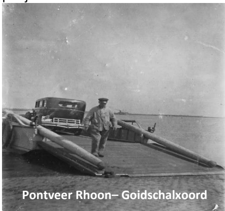
Pontveer Rhoon– Goidschalxoord

december 1933. A. Haitsma de Vries pacht het veer van 30 juni 1935 tot 30 juni 1937 voor f 750,-- per jaar.