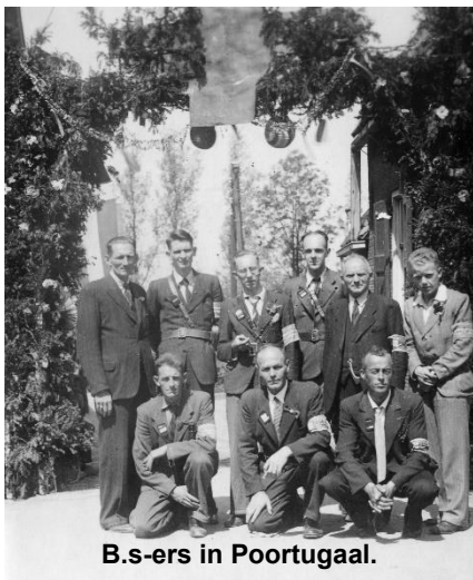
B.s-ers in Poortugaal.

Maandag 7 mei werden zij opnieuw ingerekend en later afgevoerd naar kampen ergens in Nederland.