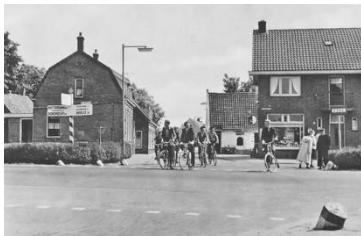
Begin jaren '60.