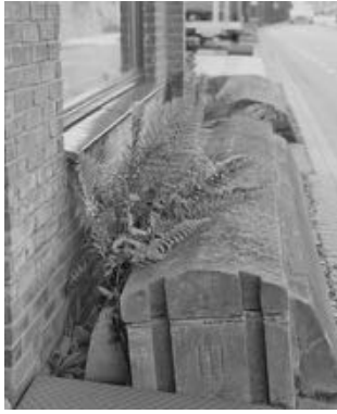
De waterkering in 2018

Nu 131 jaar later ligt er van de oorspronkelijke ruim 101 meter lange hardstenen waterkering nog ca. 80 meter, een gedeelte van de kering is geamoveerd. Aan de oostzijde is de kering 50 cm. hoog, aan de westzijde ca. 25 cm. De openingen zijn met romeinse cijfers genummerd I t/m XI. Helaas is de kering niet onderhouden, reparaties zijn uitgevoerd met cement etc., waarschijnlijk is de oorzaak dat de kering eigendom is van verschillende bewoners.