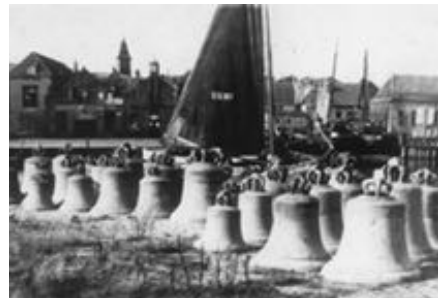
De klokken op de wal in Urk.

In drie jaren klonk mijn stem niet meer, 'k lag op de bodem van het IJsselmeer. Heldenmoed van schipper Van Dijk Liet mij zakken in het slijk. Maar nu jubel ik het uit. Besef, o mens, wat dit beduidt. Geloof van mij, dat God gewis In nood en dood uw redder is.