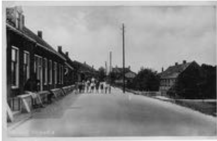
Dorpsdijk met gemetselde waterkering.

Vóór 1953 was de conditie van de dijken duidelijk niet op orde en dat was niet nieuw; Nederland was in de voorgaande tijd regelmatig getroffen door wateroverlast.