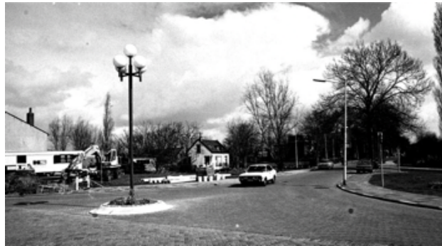
De driearmige lantarenpaal, te zien op de bovenste foto, is later vervangen door een paal met drie bollen. Te zien is ook dat de bouw van de RABO-bank gestart is.

Een kaak- of een geezelpaal was een schandpaal waaraan iemand als strafmaatregel werd vastgebonden en te kijk werd gezet. Het was in de eerste plaats bedoeld als een ontorende straf, maar het stond het publiek vrij om de gestrafte te bekogelen met rot fruit of eieren.