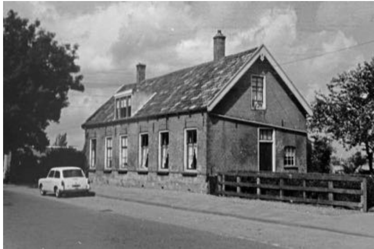
Dorpsdijk 143 en 145 in de jaren 60.

weer de naam Jaapje. Deze Jaapje, bij de oude Rhonaars beter bekend als Japie Koek, is in 1969 in Rhoon overleden, 94 jaar oud. Jaapje is als vrijgezelle vrouw tot op hoge leeftijd in haar ouderlijk huis blijven wonen en had er een snoepwinkeltje, waar zij de bijnaam Japie Koek aan te danken had. Op de toonbank stonden flessen en potten gevuld met allerlei soorten drop, zuurtjes en brokken te pronken. Behalve zakjes zwart/ wit voor 2 cent, of tover- en kauwgomballen voor 1 cent, verkocht Japie in haar hele kleine winkeltje ook rumbonen en bonbons. Had je 1 cent gevonden of gekregen dan was een toverbal snel gekocht, maar mocht je voor een stuiver snoep kopen dan was je wel even zoet met kiezen uit al dat lekkers.