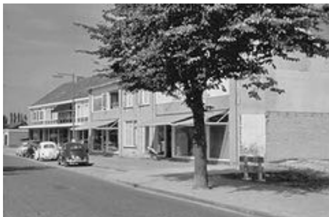
Dorpsdijk 143 t/m 153. Ca. 1965.