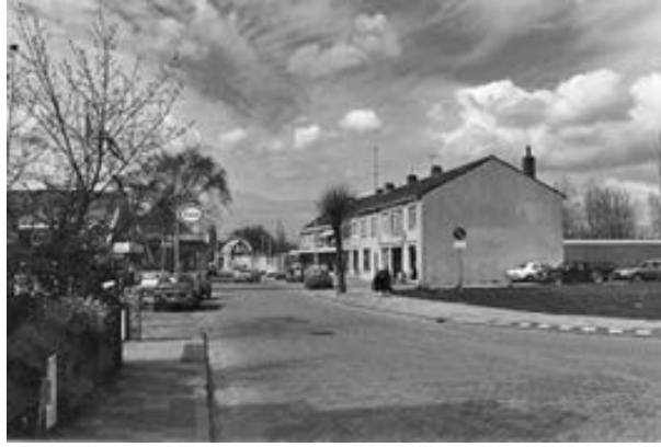
Rechts, Dorpsdijk 151 t/m 153 rond 1969.