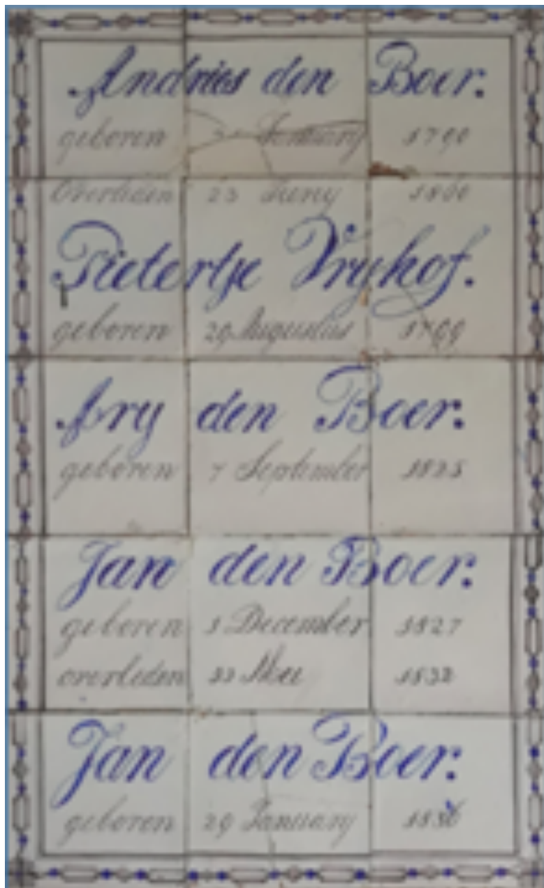
Tegeltableau afkomstig uit de woning van Visser aan de Dorpsstraat 23 te Poortugaal. Te bezichtigen in de Oudheidkamer Rhoon en Poortugaal, Dorpsstraat 27.