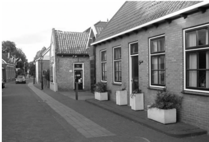
Poortugaal, Dorpsstraat 23 anno 2020.