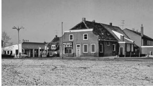
Ca. 1964. In het midden de bakkerij van Moonen, links de garage van W. Palsgraaf. Rechts de achterkant van de winkels van Bouthoorn, Kranenburg en Riethoff.

Een kaak- of een geezelpaal was een schandpaal waaraan iemand als strafmaatregel werd vastgebonden en te kijk werd gezet. Het was in de eerste plaats bedoeld als een ontorende straf, maar het stond het publiek vrij om de gestrafte te bekogelen met rot fruit of eieren.