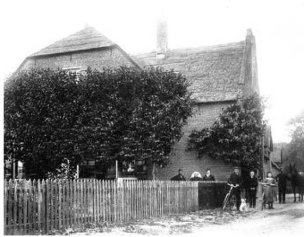
De Hooge Stee aan de Rijdsdijk zoals hij er uitzag voor de brand van 1914.

Zijn jeugd jaren zullen hetzelfde zijn geweest als die van elk ander kind in Rhoon, taakjes doen op de boerderij, op zondag naar de kerk en als je een jaar of zeven was ging je naar de openbare lagere school. Een andere schoolkeus was er nog niet in Rhoon. Daar leerde je lezen en schrijven en na de lagere school ging je bij je vader op de boerderij werken of je leerde een ander vak.