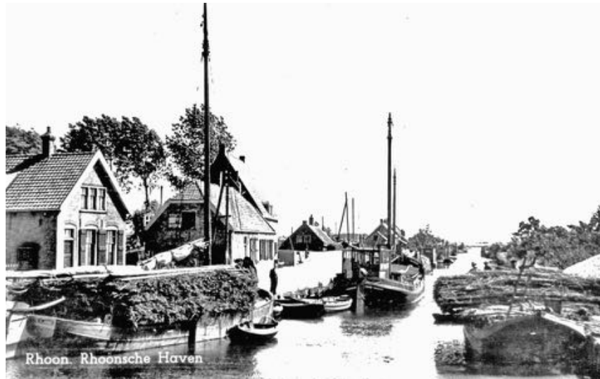
Rhoon 1943. Twee met rijshout, uit de Grienden, beladen schepen in de haven van Rhoon.

Terug naar Klein Profijt. Toen het hoog genoeg opgeslibd was, ging men er wilgen op planten om er griend te maken. Een griend is een houtakker, waarvan het hout geogst wordt door de wilgenstoven gemiddeld één keer per drie jaar van hun takken te ontdoen. Dit zgn. rijshout werd voor veel doeleinden gebruikt; in de eerste plaats voor zinkstukken die werden gebruikt voor dijkfundaties in onze deltagebieden en verder voor tientallen doelen, b.v. hoepels voor haringen andere tonnen.