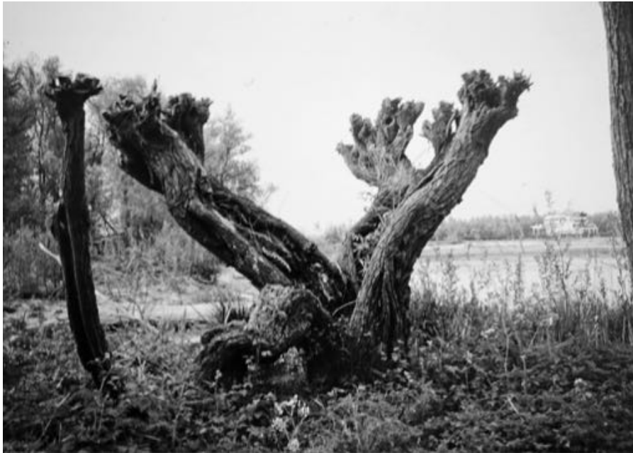
Een knotwilg van minimaal 100 jaar. Op de achtergrond de Oude Maas.

Klein Profijt is een natuurgebied langs de Oude Maas in Rhoon. Het is een langgerekt eiland, ongeveer 70 ha. groot, ca. 400 m. breed en 2,5 km. lang, aan de zuidkant begrensd door de Oude Maas, aan de noordkant door het Kooigat (dat is een afsplitsing van de Oude Maas zou je kunnen zeggen. Wij wonen in de delta van Rijn en Maas. Zoals in alle delta's wemelde het hier ooit van de eilanden en eilandjes. In de laatste duizend jaar zijn vele van die eilanden aan elkaar vastgegroeid of door mensen aan elkaar verbonden tot grotere eilanden zoals wij die nu kennen, b.v. Hoekse Waard, Goeree-Overflakkee, Voorne-Putten en ons eigen IJsselmonde. Aan de namen van deze eilanden is nog te horen dat ze uit meerdere elementen zijn ontstaan, zoals Schouwen en Duiveland en Voorne-Putten. Ook IJsselmonde is uit meerdere eilanden ontstaan.