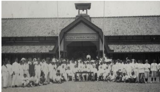
Afscheid van de Cultuurschool te Soekaboemi, 1927.

Departementsblad Teysmannia (waarvan alle jaargangen nog steeds aanwezig zijn in de Harvard University Botany Libraries). Daar kreeg hij f 2,- per bladzijde voor.