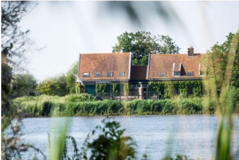
Het bezoekerscentrum "Klein Profijt" (Heinoord), aan de Oude Maas. Gezien vanuit het natuurgebied "Klein Profijt" in Rhon.