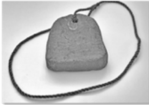
Zegensteen, om de zegen (netten) te verzwaren.

In de jaarlijkse periode dat de visserij stillag, werden er door de familie Versteeg onderhoudswerkzaamheden verricht b.v. aan de rivieroever die waren bekleed met stro of gekramd riet, en ook de netten zullen onderhoud gevraagd hebben. De vissers (het volk) waren er dan niet, die werkten waarschijnlijk als los arbeider bij boeren, dat kwam goed uit want dat is de drukste tijd in het boerenbedrijf.