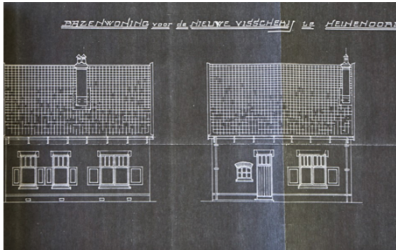
Bouwtekening uit 1916 van de bazenwoning.

Vergelijk dat eens met de huidige tijd, nu worden kinderen die enige honderden meters van de school wonen, door ouders gebracht en gehaald met de auto.